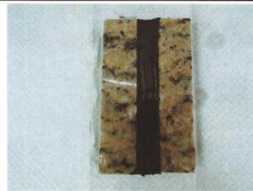
初期耐水性(試驗後)